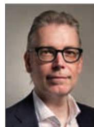
Il Sindaco Alessandro Bolis

Servizio Clienti NUMERO VERDE 800 247842 dal lunedì al venerdì dalle 8.00 alle 20.00 info@etraspa.it - www.etraspa.it